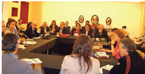
Sesión del Encuentro de Editores Universitarios de América Latina.

mundo del libro en español: la Feria Internacional del Libro de Guadalajara (FIL), donde cada año los profesionales del libro realizan negociaciones de libros y de derechos y actualizan sus conocimientos acerca de las innovaciones tecnológicas